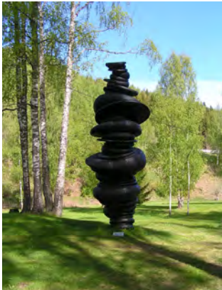
Articulated Column, 2001