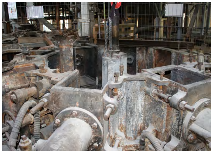
Slipemaskinen som skal settes i drift i forbindelse med prosjektet «Levende fabrikk».

sperres av og innglasses. Forprosjektet ble utført iht. plan og budsjett. Søknad om midler til igangsettingsprosjekt ble sendt Riksantikvaren i desember 2012.