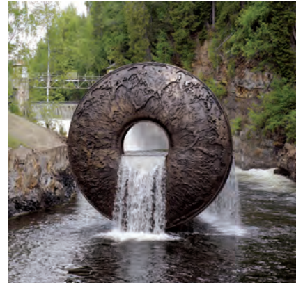
All of Nature Flows Through Us, 2011

Ved utgangen av 2012 var følgende skulpturer plassert på museumsområdet: