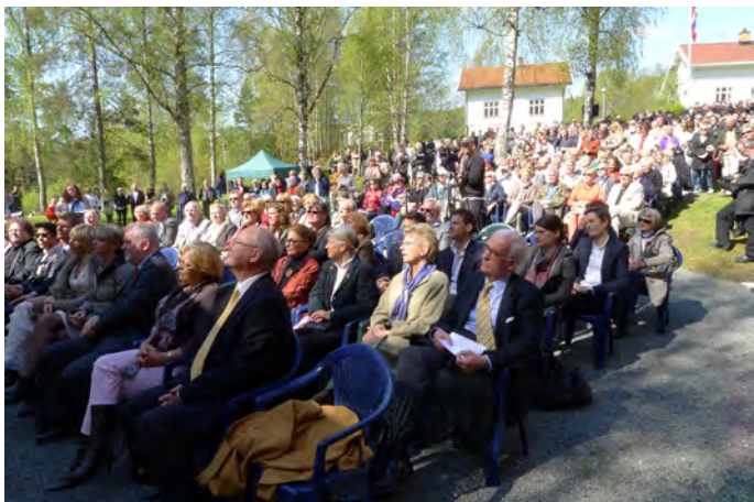
Publikum foran scenen i forbindelse med den offisielle åpningen 20. mai 2012

15. august inviterte vår hovedsponsor Kistefos AS til et meget vellykket krepselag for venner og foretningsforbindelser av Kistefos-Museet, AS Kistefos Træsliberi og Kistefos AS.