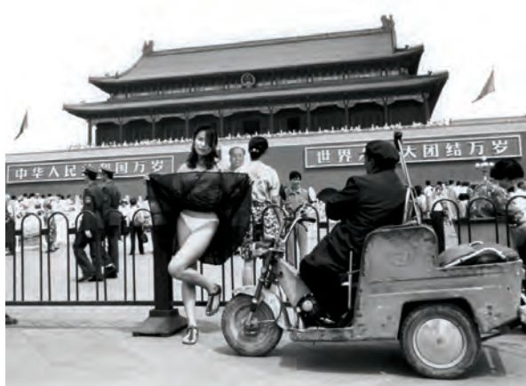
Ai Weiwei © Ai Weiwei

Ai Weiwei ble anholdt av kinesiske myndigheter 3. april 2011, på grunn av sine politiske aktiviteter. Han ble løslatt mot kausjon 22. juni 2011, men hadde fremdeles forbud mot å forlate landet under utstillingsperioden på Kistefos-Museet.