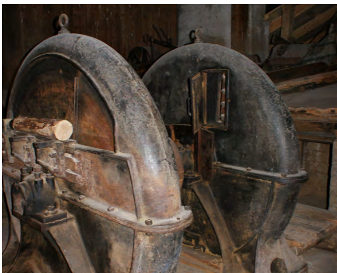
Barkehøvel i kapphuset i det gamle tresliperiet

Riksantikvaren bidro også i 2012 med betydelige tilskudd til forvaltning, drift og vedlikehold av bygningsmassen ved Kistefos-Museet. Museet fikk tildelt 1 345 000 kr i FDV-midler. Kistefos-Museet har innværende år gjort ferdig gjenstående arbeider ifm. de store prosjekttilskuddene Riksantikvaren har bidratt med de siste årene. Arbeider med spekking av østveggen på tresliperiet har blitt utført, rommet hvor barketrommelen står har blitt pusset ferdig, og mur- og pussarbeider rundt om i bygget har blitt utført. I etterkant av dette har alt av elektriske kabler blitt hengt opp, og verifisert at el-anlegget er forskriftsmessig. Stålförsterkning av bjelkelag for tresliperiloftet har blitt ferdigstilt, og loftet ble for første gang åpnet for publikum. Arbeidene med fullføringen av beskrevne prosjekter, og bruk av årets FDV-midler har gått etter plan og budsjett.