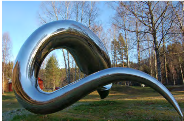
I'm Alive, 2004