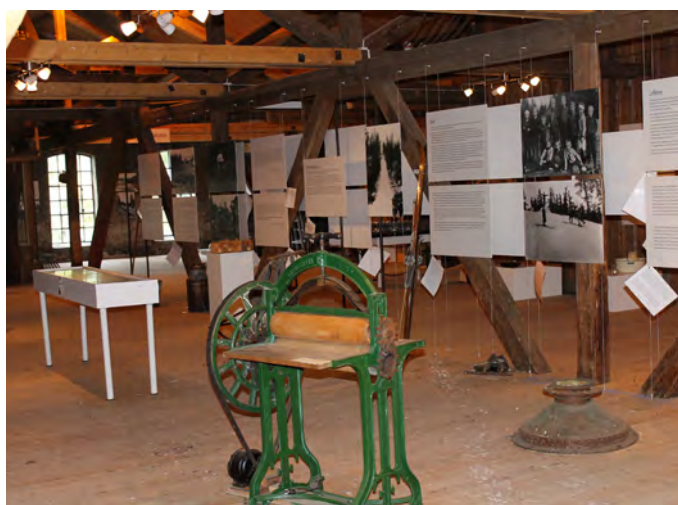
Sliperiloftets ene formidlingssone

tillegg til produksjon og bruk av tremasse og papir generelt. I formidlingen skal det tas i bruk interaktive og digitale løsninger. Det er foreløpig planlagt ti forskjellige permanente soner. Et område skal også avgrenses til bruk for temporære utstillinger innen industrihistorie. Sliperiloftet skal utvikles over tid, men håper å stå ferdig med de ti permanente sonene i 2016.