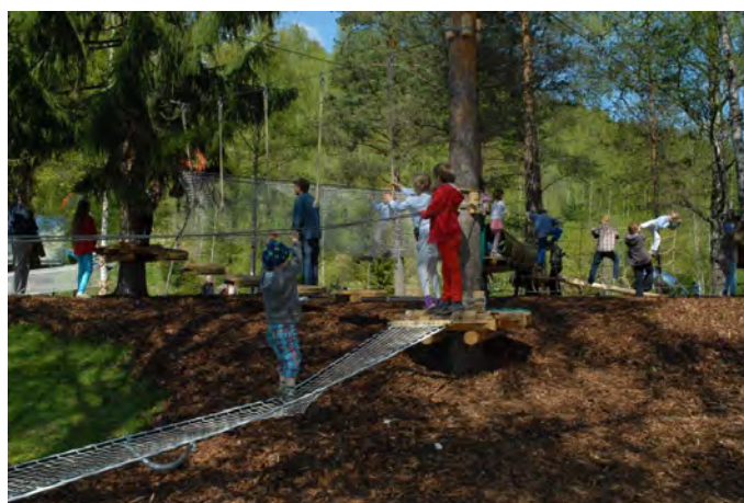
Kistefos Barnepark på museets åpningsdag 2012