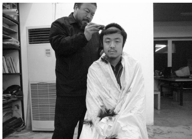
Ai Weiwei © Ai Weiwei