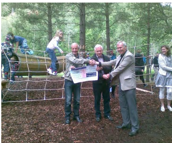
Representantene for Sparebankstiftelsene Ringerike og Jevnaker overrekker en sjekk på den offisielle åpningen av Kistefos Barnepark på Barnas Kulturdag 2012.

Barneparken er betalt av Sparebankstiftelsene Ringerike og Jevnaker.